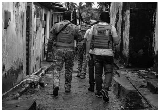
Na ano passado, foram deflagradas 1.880 ações policiais