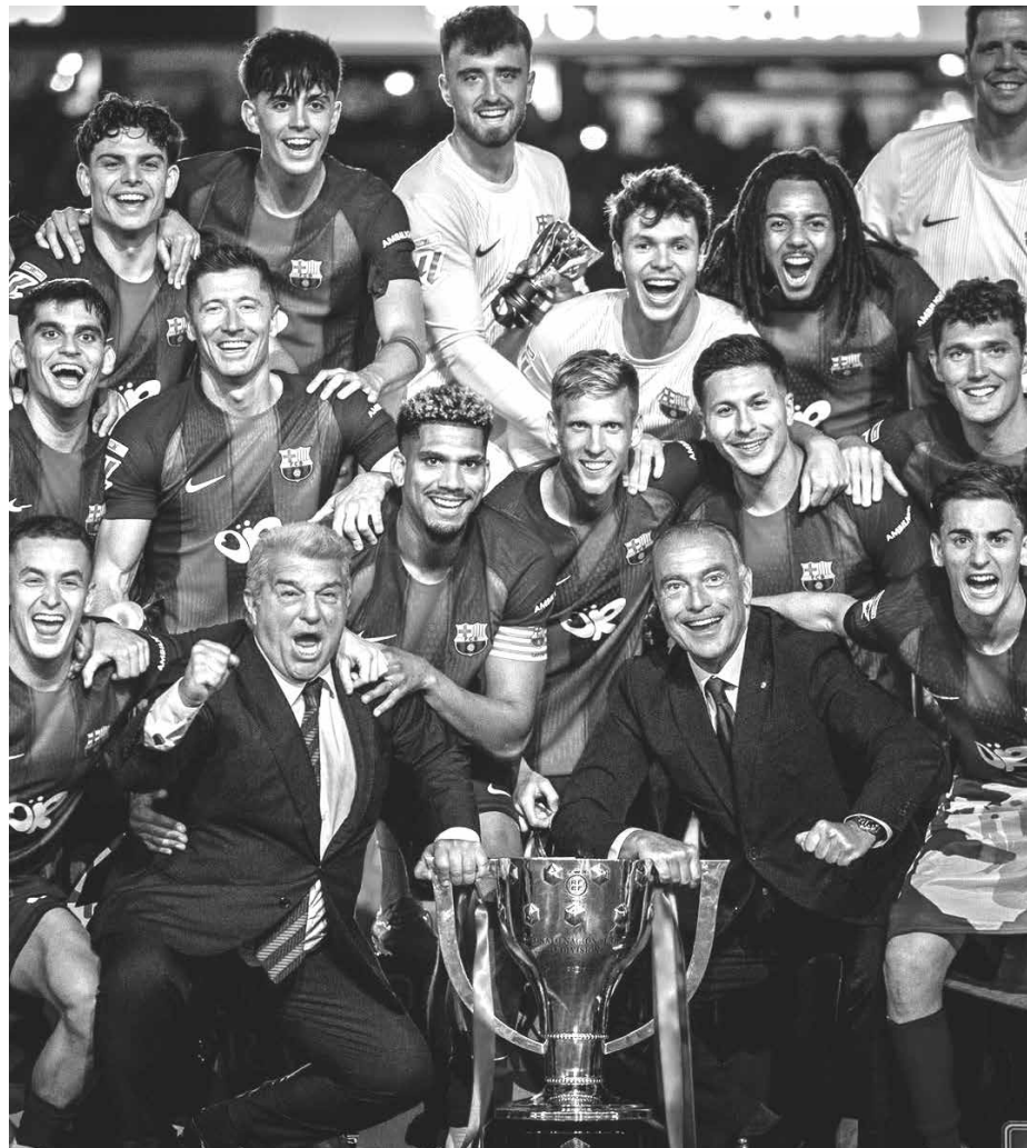
Jogadores e dirigentes do Barcelona comemoram mais um título espanhol

Valverde também não jogou, em razão de uma confusão envolvendo o colega Aurélien Tchouaméni, que foi a campo como titular. A situação entre eles evoluiu para agressão física acontecida no vestiário. Tchouaméni agrediu Valverde, que teve um traumatismo cranioencefálico, precisou ser levado ao hospital e levou pontos na cabeça.