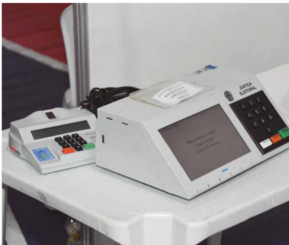
No fim do ano passado, equipe técnica avaliou urnas e sugeriu aprimoramentos