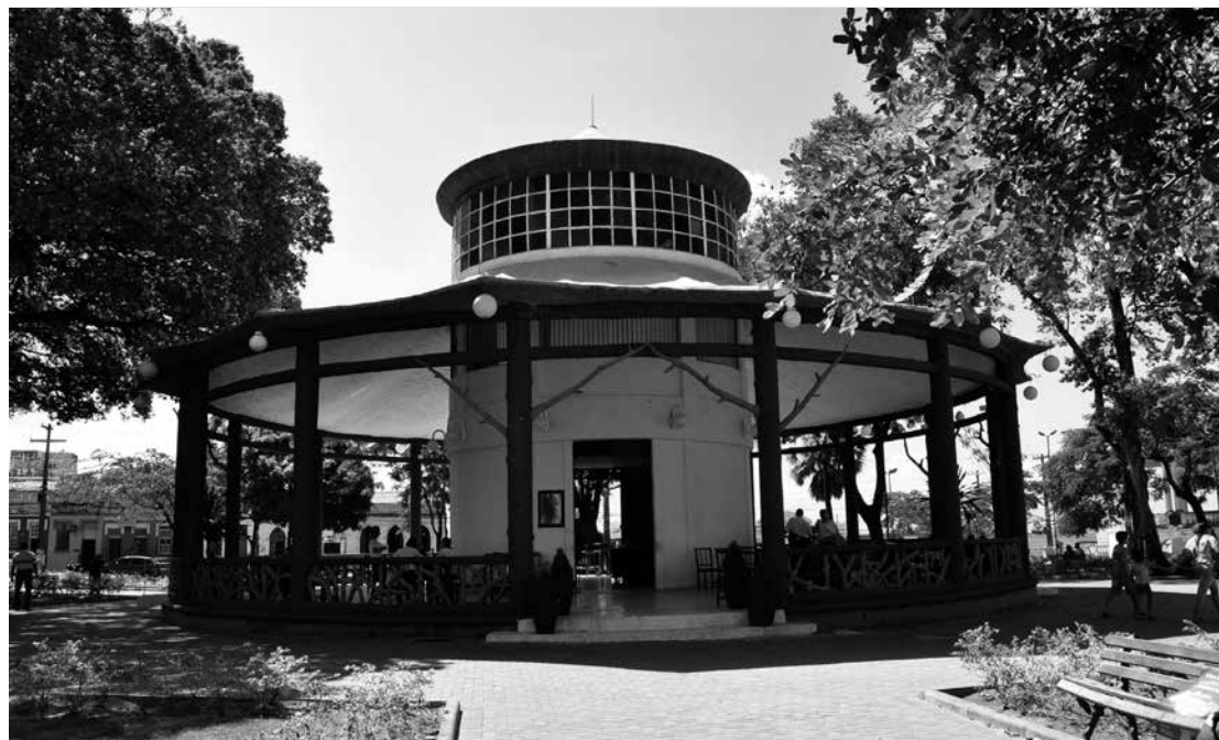
Tempos de chá