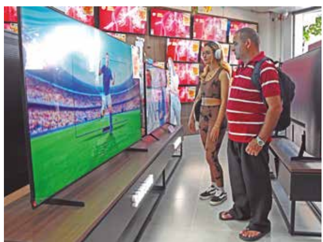
Tamanho do aparelho eletrônico é decisivo para a compra

“Desde o mês passado tem muita gente já procurando, principalmente as telas maiores. Os aparelhos mais modernos, que têm mais funções, estão tendo bastante procura”, afirma. Para o varejo, o período é o melhor do ano para a venda dos aparelhos. “É como uma Black Friday fora de época, mas exclusivamente para a TV”, resume David. A expectativa da loja é de crescimento de 20% nas vendas durante o período da Copa.