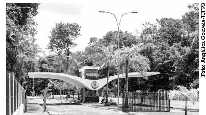
Opções vão de editor a assistente de comunicação

Para a função de assistente de comunicação e produção audiovisual, a seleção busca profissionais com experiência em criação de identidade visual, roteiri-