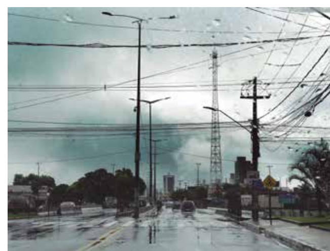
Inmet renovou alertas de chuvas até as 23h59 de hoje

“O período requer atenção redobrada. Não correr riscos desnecessários é essencial para que acidentes sejam evitados. De modo que seguir as orientações da Defesa Civil é uma decisão acertada e coerente. Qualquer fato diferente e que fuja à normalidade... é importante entrar em contato conosco. A Defesa Civil não para e está sempre disposta a ajudar a população”, finalizou. Como acionar