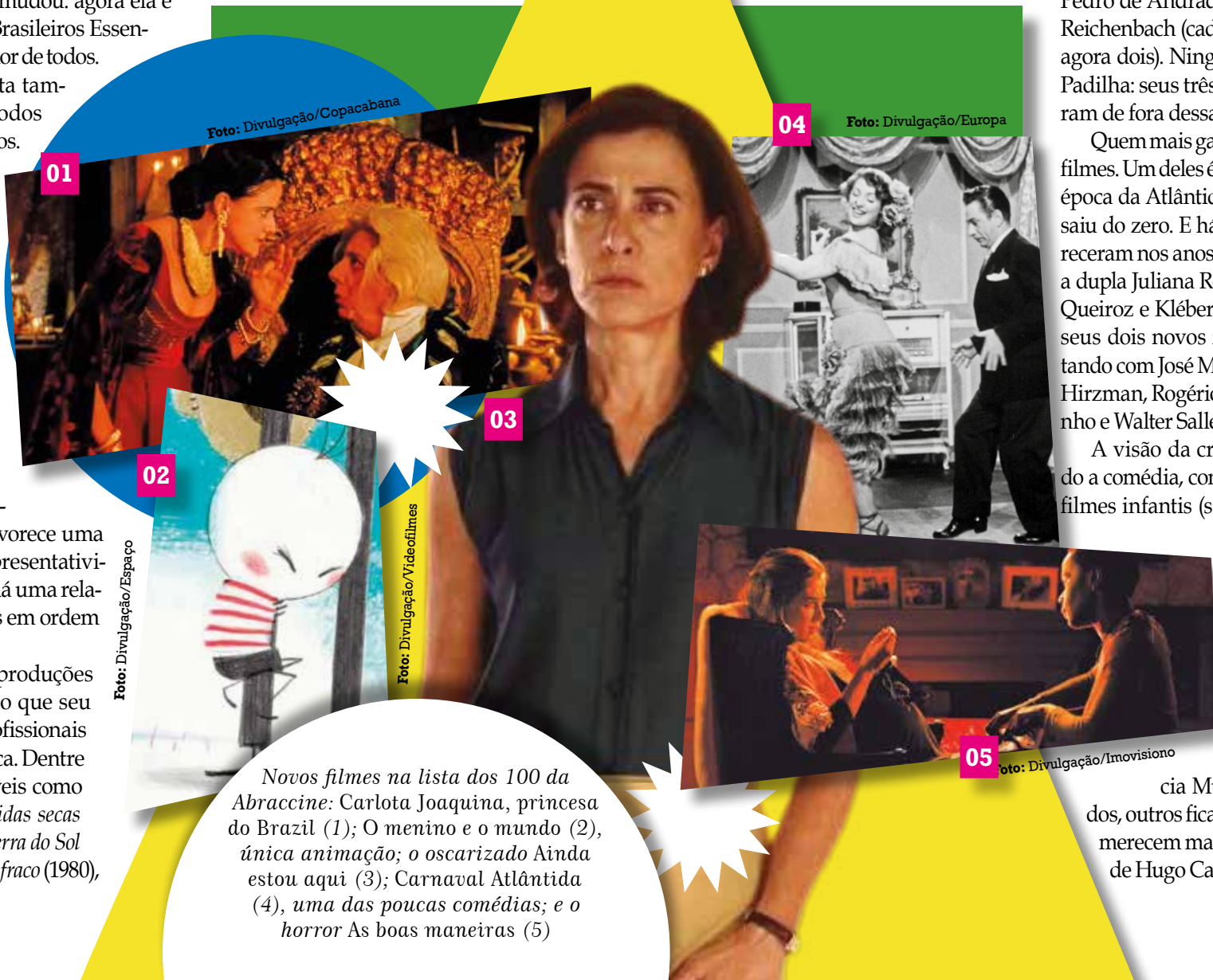
Novos filmes na lista dos 100 da Abraccine: Carlota Joaquina, princesa do Brasil (1); O menino e o mundo (2), única animação; o oscarizado Ainda estou aqui (3); Carnaval Atlântida (4), uma das poucas comédias; e o horror As boas maneiras (5)

A visão da crítica continua subestimando a comédia, com pouquíssimas citações, os filmes infantis (só Os saltimbanco trapalhões , 1981, encontrou lugar) e a animação (só um filme, O menino e o mundo , 2014, o que já é mais que em 2015, quando nenhuma animação entrou na lista dos 100). E apesar de cineastas como Carlos Hugo Christensen e Lúcia Murat serem finalmente citados, outros ficaram de fora, mostrando que merecem mais atenção dos críticos: casos de Hugo Carvana e Vladimir Carvalho.