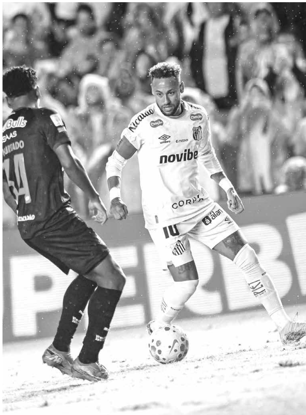
Neymar marcou um dos gols na vitória de 2 a 0 do Santos sobre o Bragantino

Até o alemão Bild parece confiar em uma convocação de Neymar. “O sonho de Neymar, superestrela brasileira, de disputar a Copa do Mundo continua vivo”, escreveu o jornal em resumo dos principais acontecimentos do fim de semana.