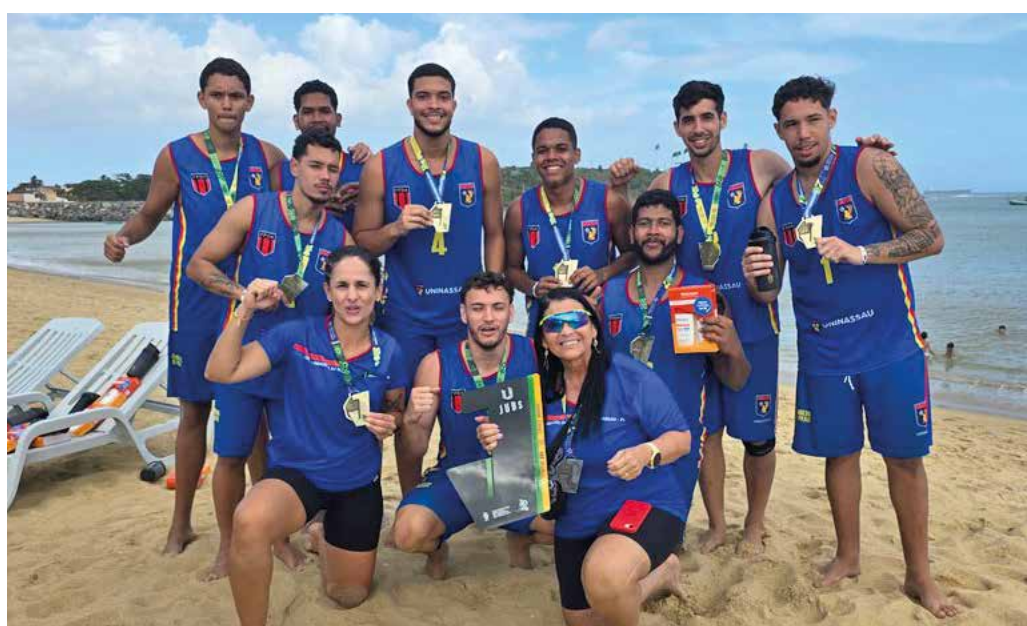
A equipe masculina de handebol do estado levou a medalha de ouro na competição