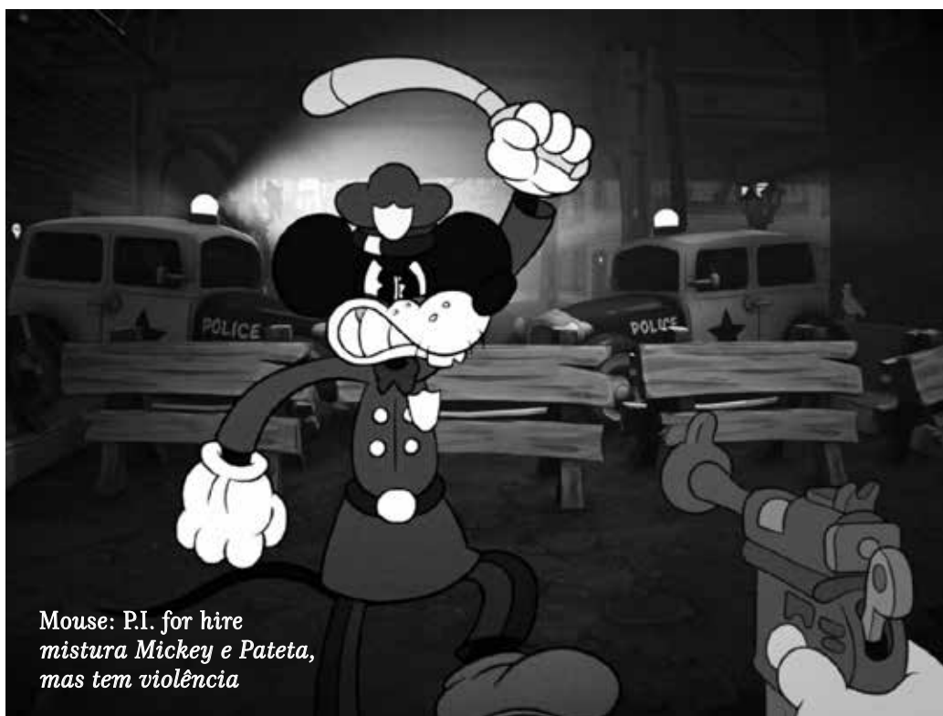
Mouse: P.I. for hire mistura Mickey e Pateta, mas tem violência

Com campanha de aproximadamente 12 horas de duração, Mouse: P.I. for hire também se inspira em clássicos de tiro FPS, como Doom (1993) ou Quake (1996). Entre as críticas levantadas por veículos especializados, como IGN , está principalmente a de que o game incorre constantemente em dissonância ludonarrativa — a incoerência entre a narrativa contada e os elementos narrativos construídos pela jogabilidade —, com Pepper invadindo delegacias, incendiando uma casa de ópera e passando incólume, acima do bem e do mal. Mas isso não chega a roubar do game o encanto produzido pela estética noir ou pelas boas referências que faz às histórias detetivescas.