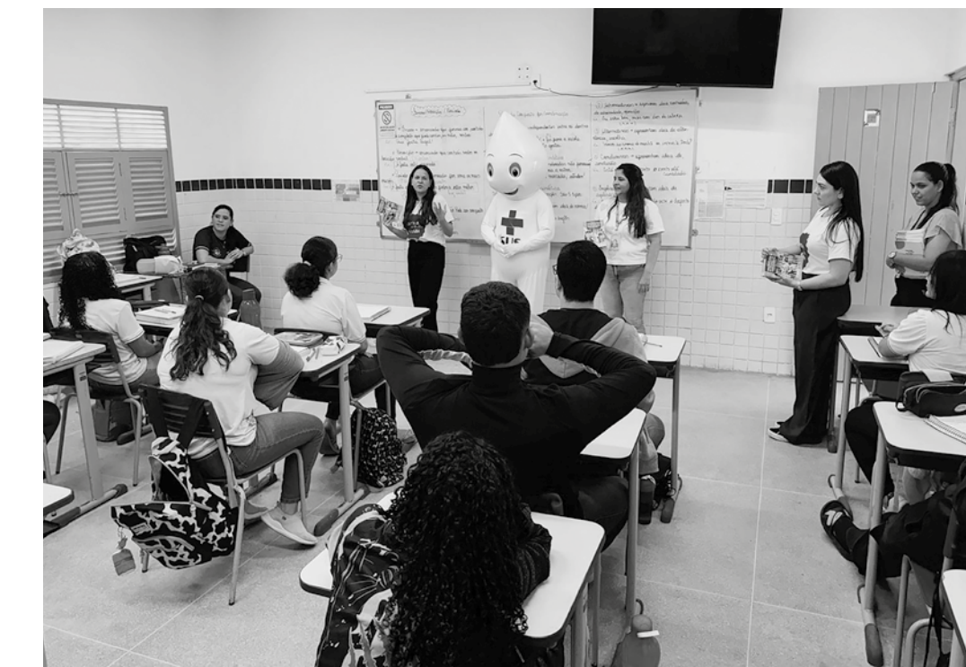
Alunos tiveram a oportunidade de atualizar as vacinas e tirar dúvidas com o Zé Gotinha