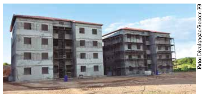
Serão 100 apartamentos de 46,1 m 2 , além de área de lazer

Os apartamentos possuem 46,1 m 2 , distribuídos em dois