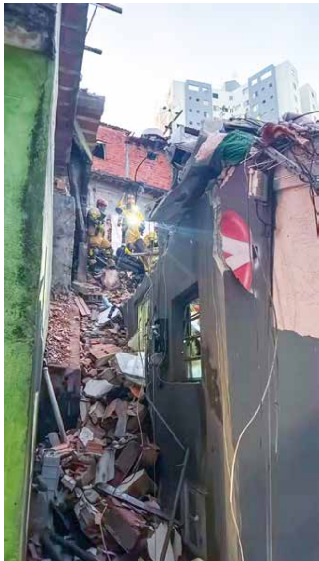
Explosão pode ter sido provocada por uma obra da Sabesp