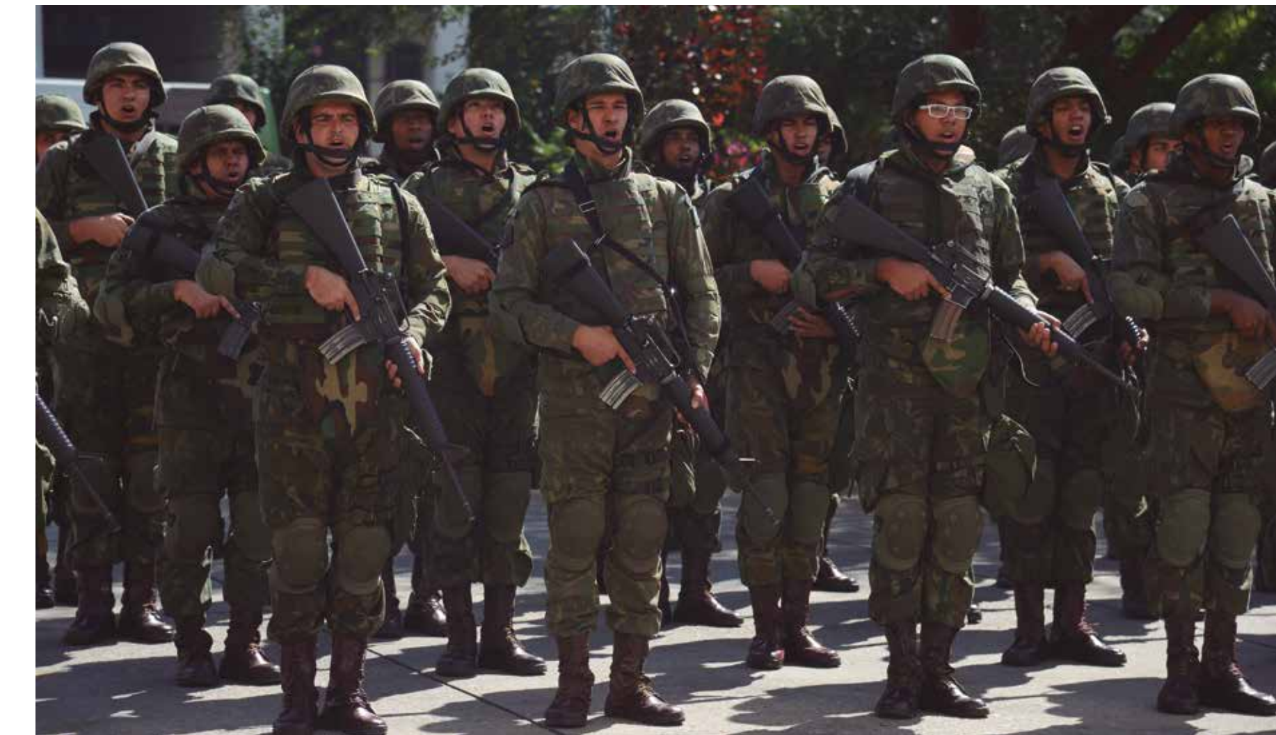
De acordo com o TRE-PB, a requisição pode ser submetida ao governador da Paraíba, às forças de segurança locais e ao Ministério Público Eleitoral