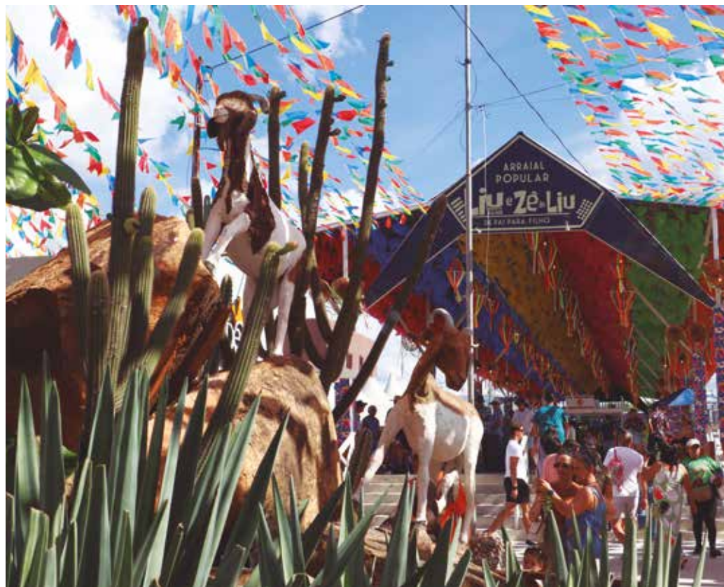
Evento deve injetar aproximadamente R$ 5 milhões na economia da Roliúde Nordestina