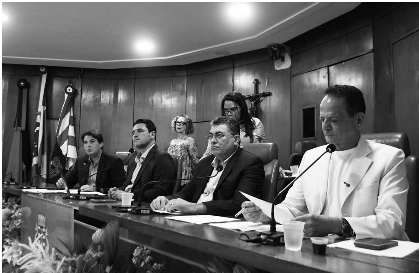
Na reunião de ontem, colegiado da CMJP também aprovou 20 projetos de lei ordinária e três projetos de decreto legislativo

A reserva estabelecida estende-se aos programas habitacionais que receberem subvenção, benefício, incentivo fiscal ou creditício de entidades ou órgãos da administração pública de João Pessoa.