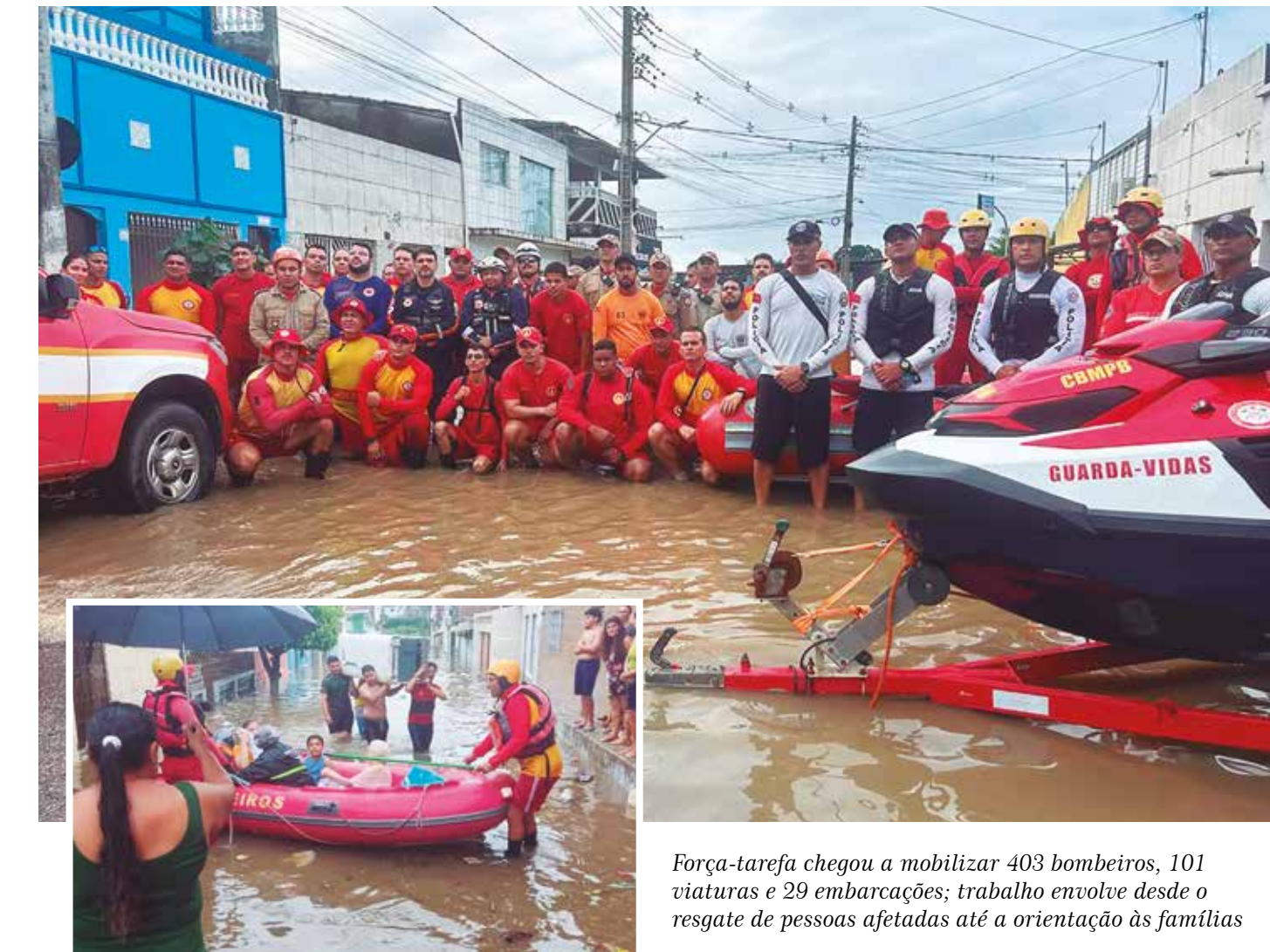
Força-tarefa chegou a mobilizar 403 bombeiros, 101 viaturas e 29 embarcações; trabalho envolve desde o resgate de pessoas afetadas até a orientação às famílias

Ainda segundo o comandante, a prioridade da equipe é salvar vidas, prestar assistência às famílias atingidas e estar presente nas áreas mais afetadas pelas chuvas. “Esse trabalho conjunto foi fundamental para ampliar a capacidade de resposta e assegurar que o apoio chegasse a quem mais precisava”, reforçou.