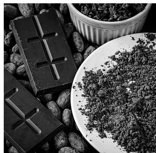
Indústria terá 360 dias para adaptar-se às novas regras

Em caso de descumprimento das regras, os responsáveis estarão sujeitos às sanções previstas no Código de Defesa do Consumidor, além de outras penalidades sanitárias e legais cabíveis.