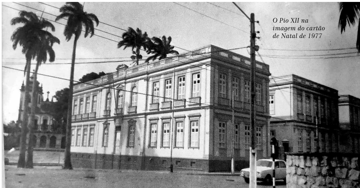
O Pio XII na imagem do cartão de Natal de 1977